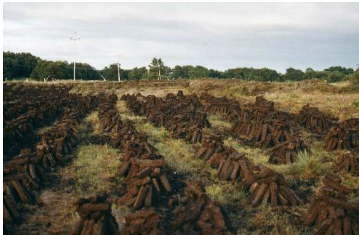
Torfabbau heute in Irland