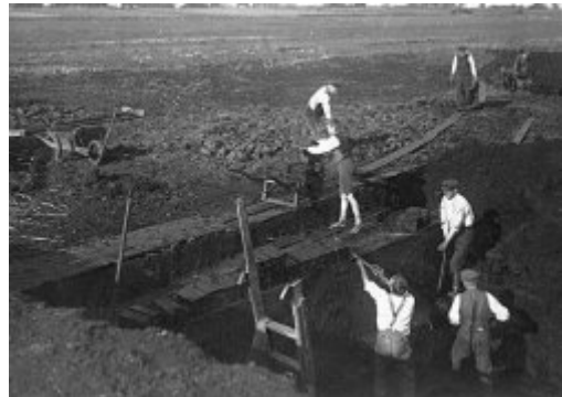
Torfstechen im Lindener Moor in den 1940er Jahren

gewissen Brenntorfanteil. [Die Kombination von Streu – und Brenntorfabbau ist auch in der Dokumentation von Schreiber 1910 nachlesbar.] Im Bereich Kojen-Hochhäderich reichte eine Seilbahn bis nach Riefensberg ins Dorf , zum Transport von Torfbällen . Wer Glück hatte durfte mit der Seilbahn zwischen Riefensberg-Dorf und Kojen mitfahren. Berichte von 800 kg schweren Schweinen die mit der Seilbahn transportiert worden sind, kommen aus der Runde der Zeitzeugen.