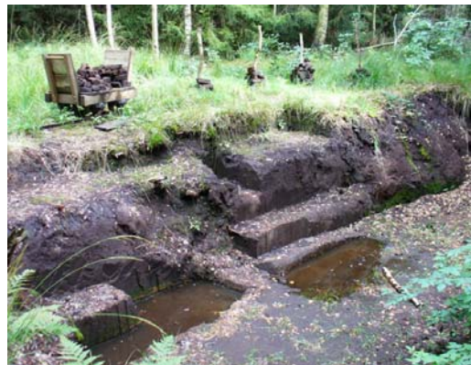
Torfabbau im Wurzacher Ried

Die regionale Bedeutung des Kojenmoos und seine Kulturgeschichte finden auch ihren Niederschlag beim moore Stammtisch in Krumbach.