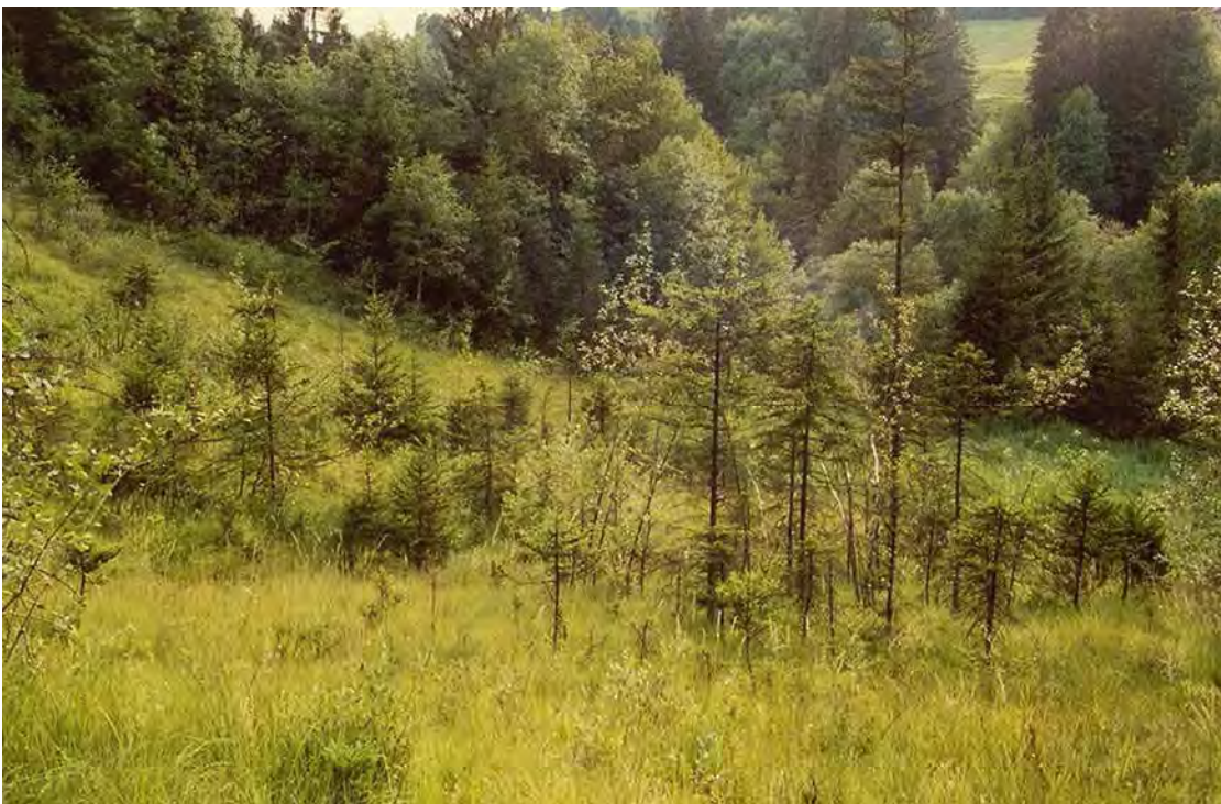
Abbildung 5: Blick auf den mittleren, offenstem Hangbereich mit natürlich aufkommenden Fichten.

Durch Nutzungsaufgabe verbuschendes Hang-Davallseggenried an den Abhängen zur Weissach. Östlich der Weissachbrücke erstreckt sich bis zur Weissach ein vernässter Hang über Molasse. Er wird von einem Davallseggenried und Pfeifengraswiesen eingenommen. Der Anteil an Pfeifengras ist großteils hoch, lokal und kleinflächig ist auch ein Schilfreinbestand ausgebildet. Randlich sind bereits verwaldete Bereiche mit Eschen- und Grauerlenwald in die Fläche integriert. Die Fläche wird seit Jahrzehnten nicht mehr gemäht. Die Verbuschung findet vor allem über Faulbaum ( Frangula alnus ) und Grauerle ( Alnus incana ) sowie mit kümmernden Fichten statt. Bemerkenswert ist, dass trotz fehlender Nutzung immer noch Freiflächen vorhanden sind.