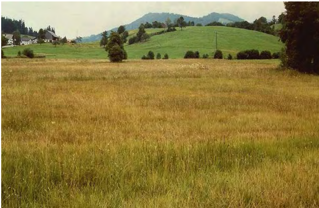
Abbildung 12: Blick nach Norden über die Moorfläche bei Wolfbühl.

Beeinträchtiger Hochmoorrest mit anschließenden Flachmoorbeständen. nördlich der Straße von Krumbach nach Langenegg beim Güterweg nach "Moos" auf einer Hangverebnung. Neben dem eher trockenen Hochmoor kommen Braunseggenmoore ( Caricetum fuscae ), schöne Bereiche mit Alpenwollgras ( Trichophorum alpinum - Gesellschaft), Davallseggenrieder ( Caricetum davallianae ), Pfeifengraswiesen ( Molinietum caeruleae ) und Übergänge zu Bachdistelwiesen ( Cirsietum rivularis ) vor. In der Teilfläche nördlich der Straße liegt ein reiches Vorkommen des Sumpflappenfarn ( Thelypteris palustris ).