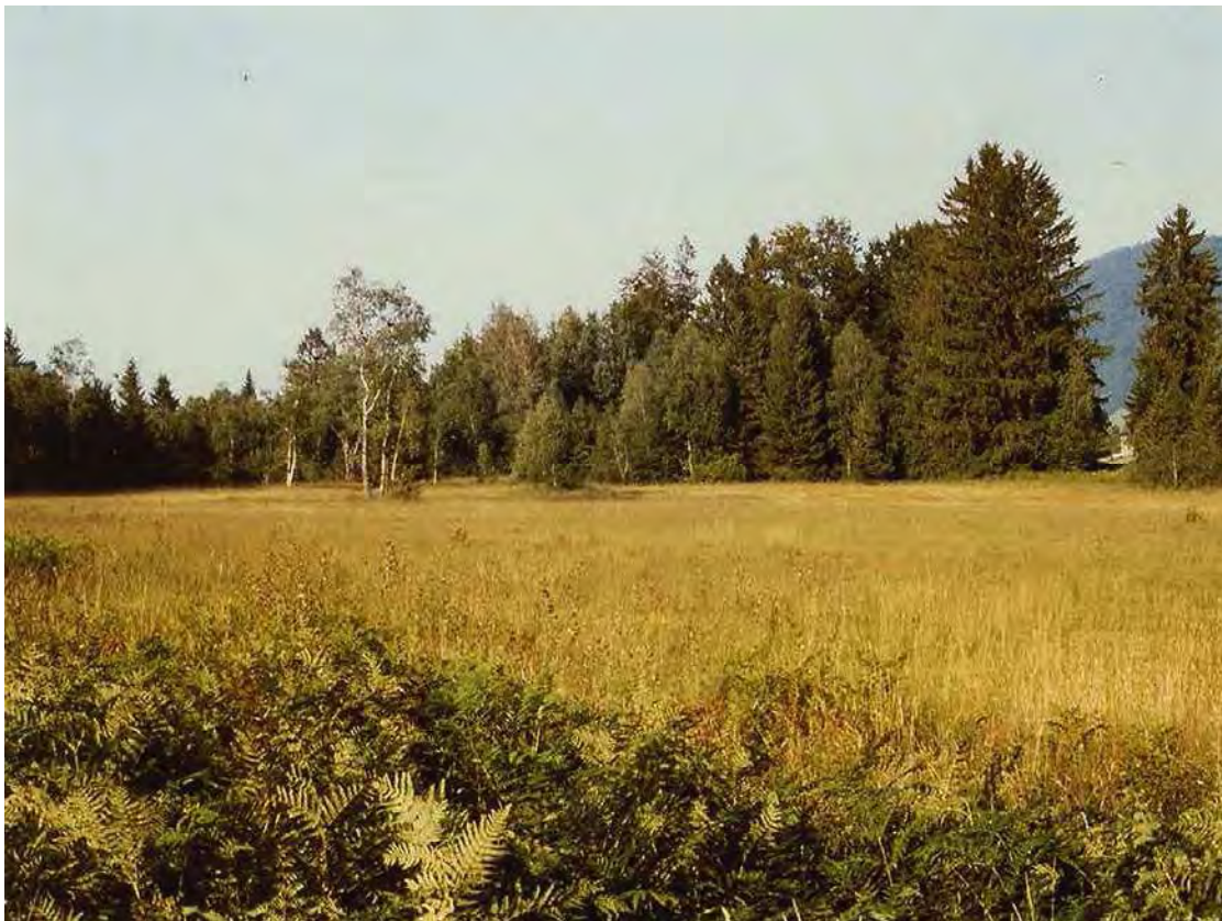
Abbildung 2: Blick von Westen über den Moorkomplex bei Salgenreute.

Insgesamt sind die Moorflächen gut erhalten, deutlich ist aber ein randlicher Nährstoffeintrag, vor allem im Zwischenmoorbereich erkennbar. Im Süden und im Nordosten wurden kleine Pfeifengraswiesen und Kalkflachmoore der Biotopfläche hinzugefügt. Lokal ist ein Eindringen von Neophyten (Kanadische Goldrute) sowie die Ausbreitung von Adlerfarn und Selbstanflug von Zitterpappel und Fichte zu beobachten.