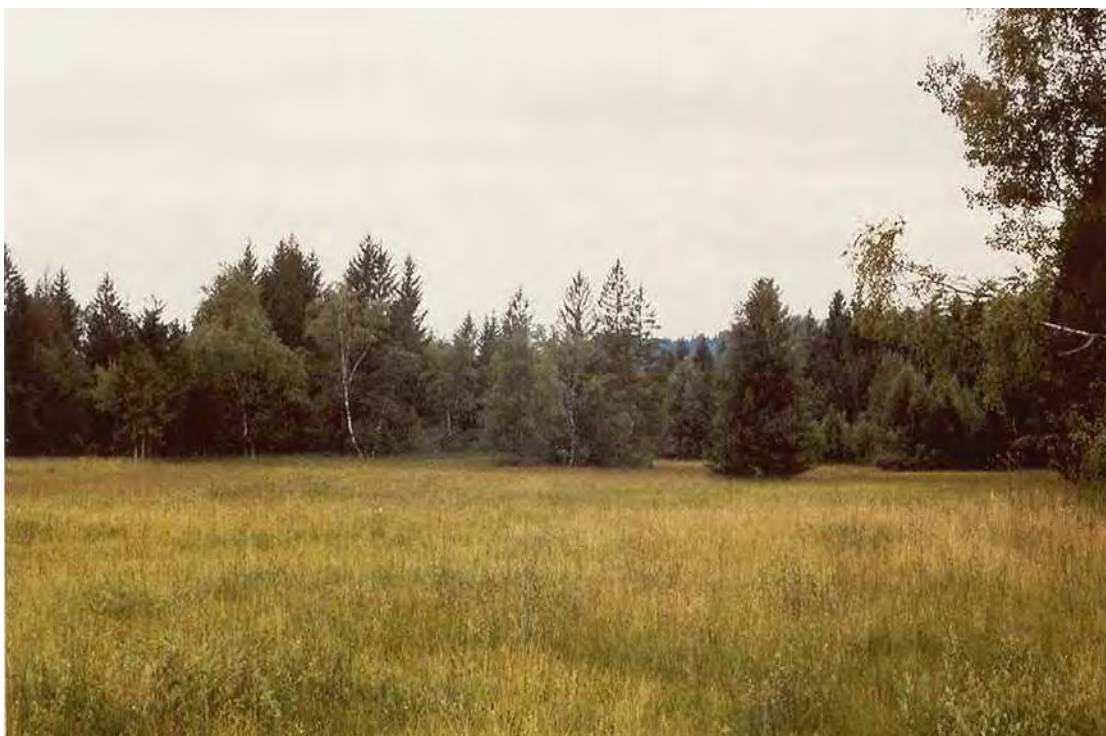
Abbildung 8: Blick von der zentralen Moorfläche nach Westen.

Teils bruchwaldartig verbuschende Hochmoorrestfläche mit Hundsstraußgras und Fadensegge im Naturschutzgebiet Rossbad. Die Fläche befindet sich nördlich des Kurhauses Rossbad auf der Terrasse ob der Weissach. Den Untergrund bilden bis 3 m mächtige Torfschichten auf Grundmoräne. Die Mooswiesen sind unterschiedlich stark verheidet und weisen drei Entwässerungsgräben auf. Randlich sind kleinere Zwischenmoorstadien und Braunseggenmoore ( Caricetum fuscae ) entwickelt. Nicht mehr genutzte Moorflächen entwickeln sich bruchwaldartig mit Moorbirke ( Betula pubescens ), wodurch sich, in Verbindung mit den Baumzeilen entlang der Gräben, ein landschaftlich sehr reizvolles Bild ergibt. Die Bestände sind gut erhalten.