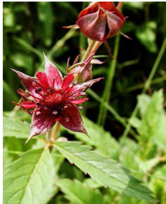
Abbildung 14: Links die stark gefährdete Knötchen-Simse ( Juncus subnodulosus ) eine seltene Art der Kalkflachmoore, rechts das Sumpf-Blutauge ( Potentilla palustris ) eine charakteristische Art der Zwischenmoore.