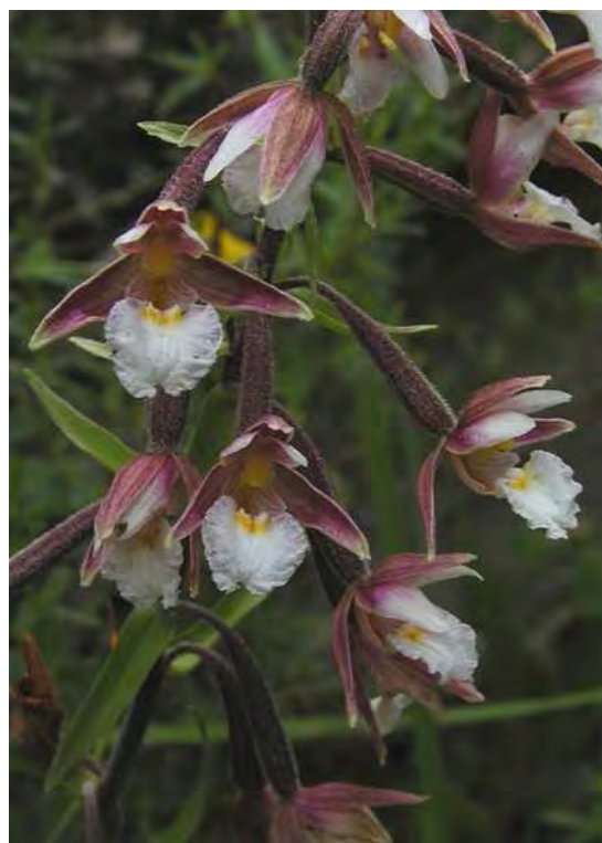
Abbildung 10: Das Weiße Schnabelried ( Rhynchospora alba ), links, ein seltenes Sauergras der Hochmoore und der Sumpfstendel ( Epipactis palustris ), rechts, eine charakteristische Orchidee der Flachmoore.