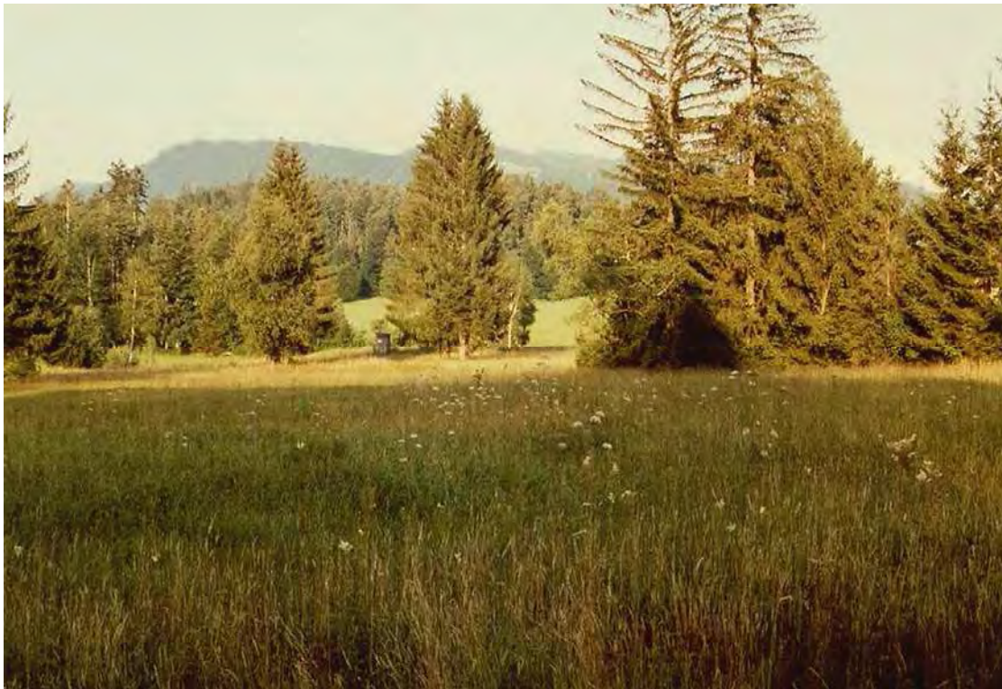
Abbildung 9: Blick über die Moorfläche nach Osten.

Landschaftlich durch die reiche Strukturierung mit Baumreihen sehr reizvoller Hochmoorrest mit anschließenden Flachmooren, nördlich der Straße von Krumbach nach Langenegg gleich unterhalb des Gasthofes. Das Moor weist eine fragmentarische Bulten- und Schlenkenbildung auf, ist aber durch alte Entwässerungsgräben großteils verheidet. Im Randgehänge finden sich Braunseggenmoore ( Caricetum fuscae und Caricetum fuscae molinietosum ) und Pfeifengraswiesen ( Molinietum caeruleae ). Kleinflächig sind Ausbildungen mit Alpenwollgras ( Trichophorum alpinum -Gesellschaft) zu finden. Im Nordteil sind Verbuschungstendenzen mit Zitterpappel, Stieleiche oder Birke zu beobachten.