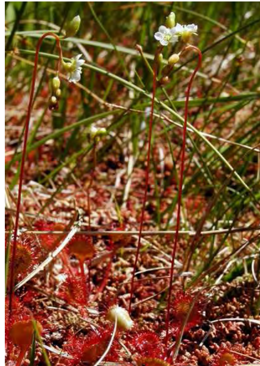
Abbildung 7: Die beiden gefährdeten Hochmoorarten Rosmarinheide ( Andromeda polifolia ), links und der Rundblättrige Sonnentau ( Drosera rotundifolia ), rechts.