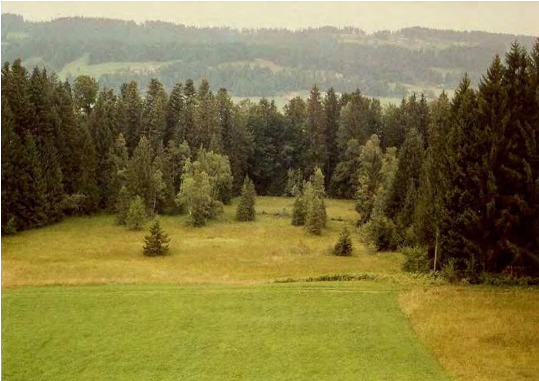
Abbildung 6: Blick von Norden über das Hochmoor Richtung Weißach.

Landschaftlich äußerst reizvolles kleines Hochmoor mit erstaunlicher Artenvielfalt, vereinzelt Spirken und Vorkommen des Mittlerem Sonnentau ( Drosera intermedia ) nördlich der Ortschaft Engisholz auf einer Terrasse oberhalb der Weissach. Den Untergrund bilden bis zu zwei Meter mächtige Torfschichten auf Moränenmaterial. Ein ehemaliger, über natürliche Sukzessionsvorgänge verwachsener Torfstich befindet sich in der Fläche. Am Nordost-Hang schließen zwei Flachmoorstücke an. Die Moorvegetation ist insgesamt erstaunlich artenreich.