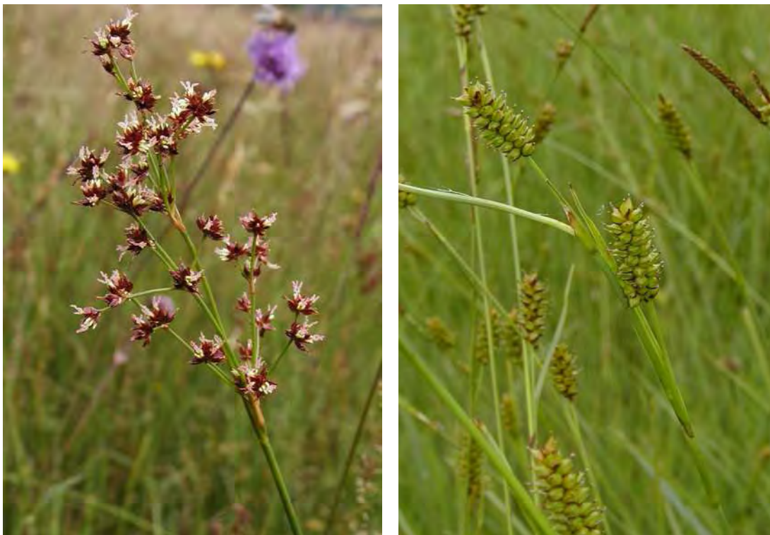
Abbildung 11: Die Spitzenblütensimse ( Juncus acutiflorus ), links, eine typische Art der bodensauren Pfeifengraswiesen und die Saum-Segge ( Carex hostiana ), rechts, eine Art der Kalkflachmoore.

Flachmoor beidseitig des neuen Zufahrtsweges zum Kurhaus Rossbad und südlich davon mit vorherrschender Pfeifengraswiese ( Molinietum caeruleae ), kleinem Braunseggenmoor ( Caricetum fuscae ) und Anklängen an ein Zwischenmoor. Die Fläche besitzt schöne Bestände des vom Aussterben bedrohten Hundstrauchgrases ( Agrostis canina ).