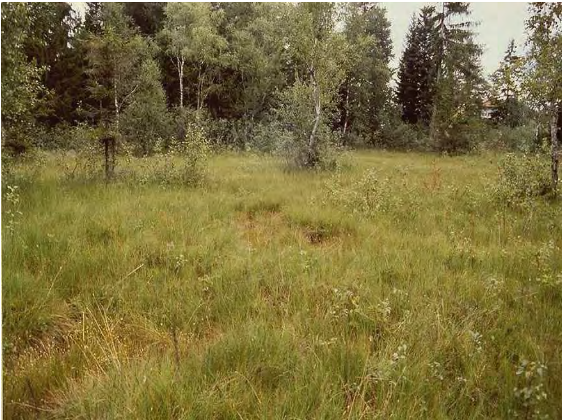
Abbildung 4: Blick über die zentralen Teile des Hochmoores bei Glatz.

Kleinflächiges, aber schön entwickeltes Hochmoor mit Vorkommen von vom Aussterben bedrohten Arten südlich der Verbindungsstraße Krumbach-Langenegg im Ortsteil Glatz. Im Untergrund finden sich bis zu drei Meter mächtige Torfschichten auf Gletscher-Grundmoräne. Die zentralen Teile des Moores weisen eine ausgeprägte Bulten-Schlenken-Struktur ( Sphagnetum magellanicum und Rhynchosporium albae ) und üppigen Vorkommen des Mittleren Sonnentau ( Drosera intermedia ) auf. Die sind als Braunseggenried ausgebildet ( Caricetum nigrae ). Durch den lockeren Gehölzbestand der Fläche besitzt das Moor auch eine große landschaftliche Schönheit. Bei den südlichen Bereichen am Waldrand handelt es sich vornehmlich um Pfeifengraswiesen, die teilweise nicht mehr gemäht werden und eine beginnende Verbuschung durch Fichten zeigen.