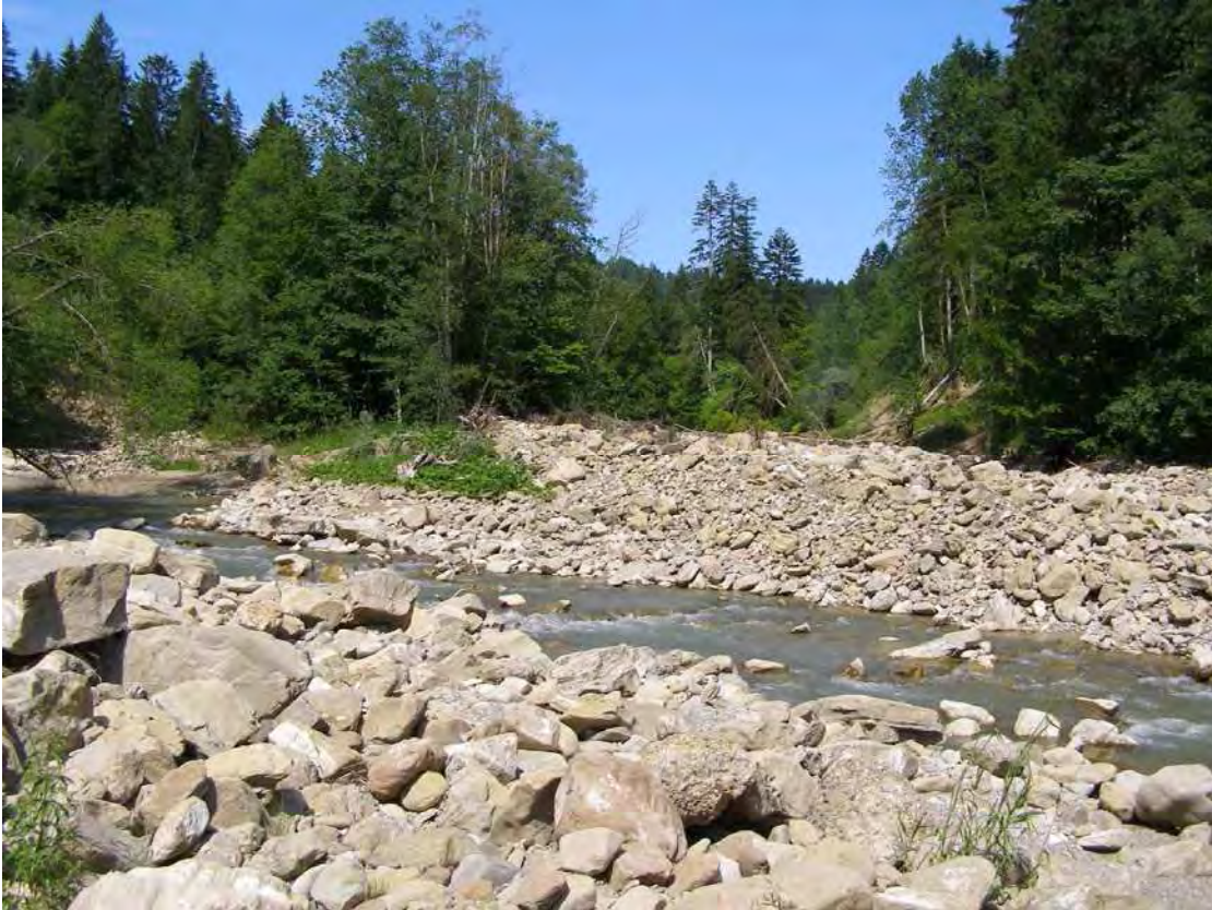
Abbildung 15: Blick auf die Weissach an der Gemeindegrenze Richtung Nordosten ins Gemeindegebiet von Doren und Krumbach.